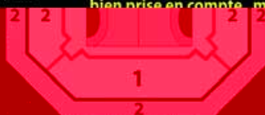
Cat 1 : places numérotées Cat 2 : placement libre