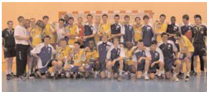
Photo prise lors du match ED Franc jeune masculine contre la D2 de Massy le 6 mai 2008

En espérant pouvoir travailler à nouveau ensemble.