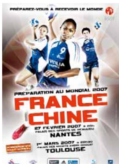
Préparation Mondial 2007 – Rencontres France / Chine